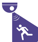
Détection d'intrusion de zone