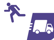
Classification Humains / Véhicules