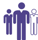
Détection d'entrée / sortie de zone