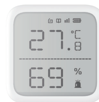
Détecteur de Température & d'Humidité