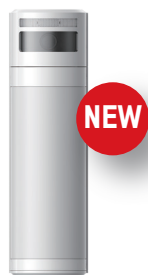
Détecteur extérieur Tri-Tech